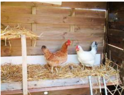
Poules dans le poulailler

Le poulailler doit être protégé des prédateurs: renards, fouines, rapaces, chiens, rongeurs.